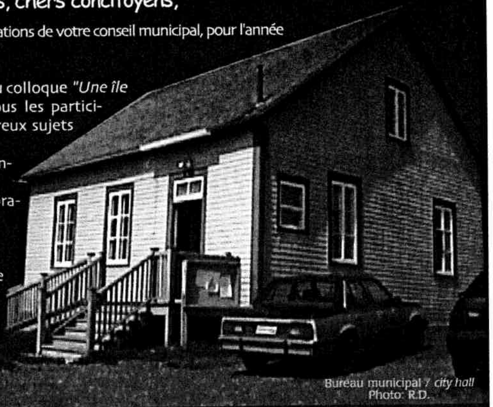
Bureau municipal / city hall