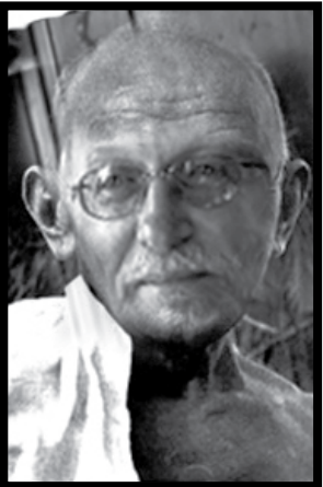
Sans paroles RD

Difficile? Tout dépend. En tant que propriétaire et membre d'Inter-Rives, chacun de nous est responsable de l'état de santé et du climat social de notre île. Profitons-en, puisque nous sommes à la fois privilégiés et encore relativement peu nombreux, pour raffiner notre sens civique et cultiver notre capacité d'adaptation.